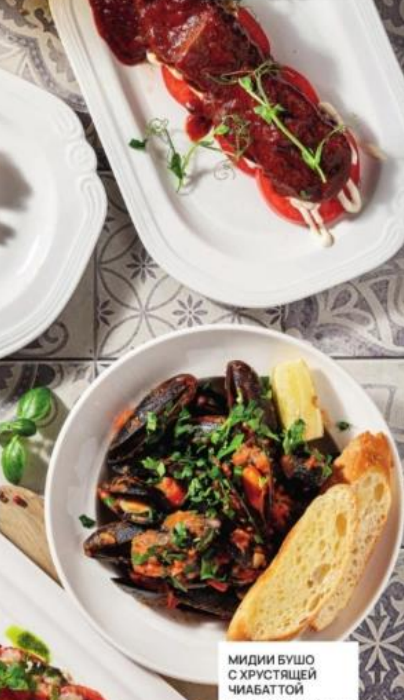
МИДИИ БУШО С ХРУСТЯЩЕЙ ЧИАБАТТОЙ